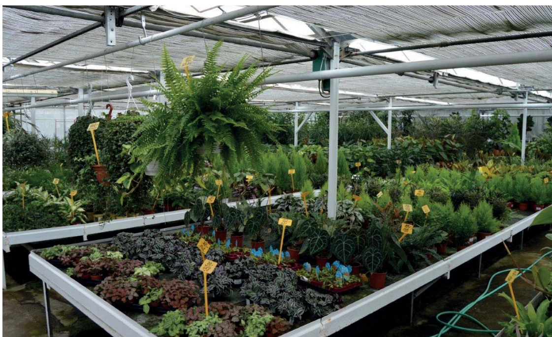
Prodejna pokojových květin