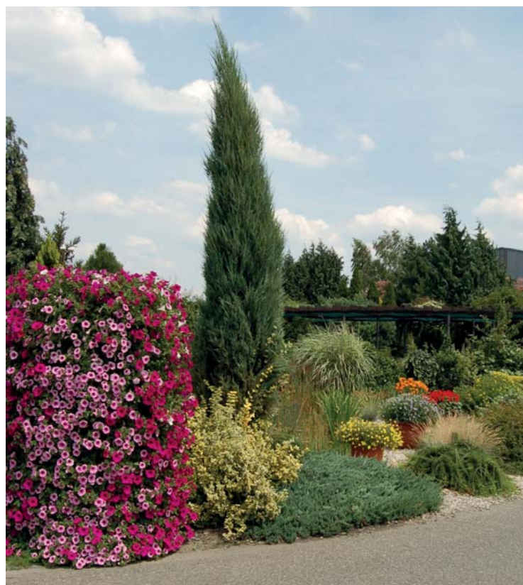
Venkovní prodejna Florcenteru