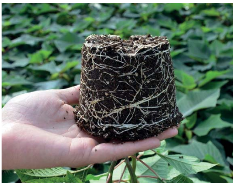
Pěstování Poinsettia ve Florcenteru – substrát Florcom

efektivity výroby a také plánuje v areálu podniku vybudovat nové zahradní centrum. Právě zahradní centrum bude první větší investicí, která přiláká větší počet koncových zákazníků a navýší prodeje, jež nebudou zatíženy nákladnou dopravou a skonty obchodních řetězců. Také chceme podpořit vlastní velkoobchod a budeme se více věnovat velkoobchodům a dalším partnerským zahradním centrům. Právě pro zahradní centra připravujeme nové koncepty a nový sortiment pěstovaných květin. Rozšíříme také spolupráci s dalšími zahradníky nejen